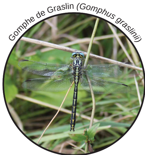
Gomphe de Graslin ( Gomphus graslinii )