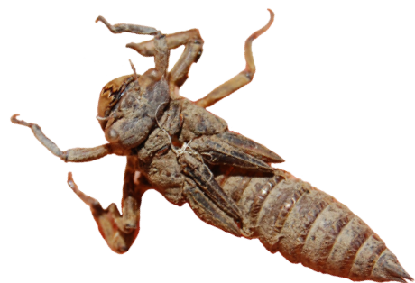
Exuvie d'un odonate

Les trois espèces cible ont bien été trouvées parmi ces exuvies !