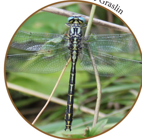
Gomphe de Graslins