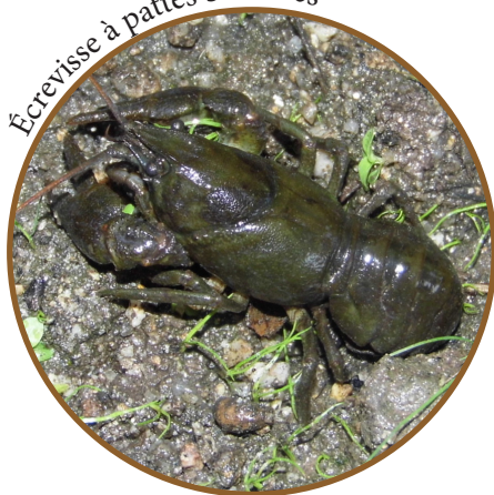
Ecrevisse à pattes blanches