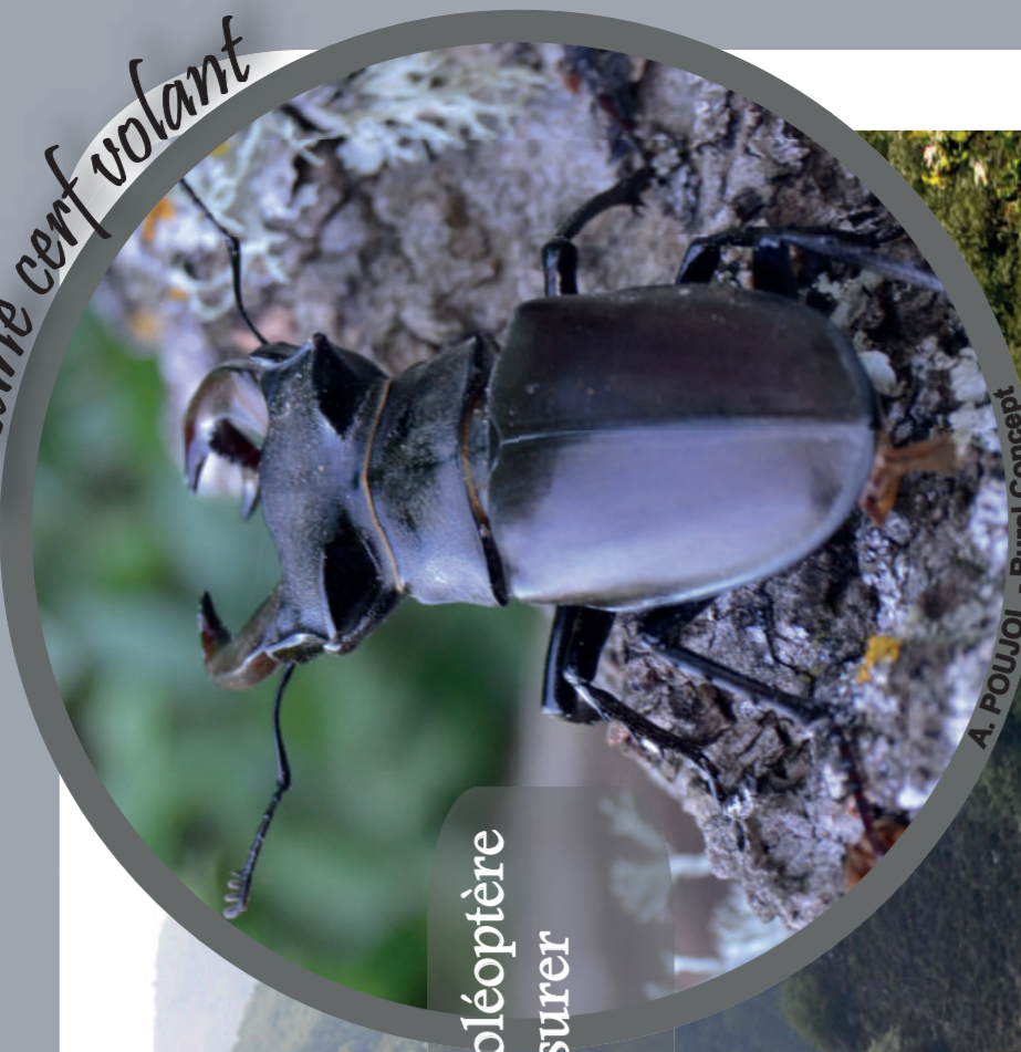
Lucane cerf volant

C'est le plus grand coléoptère d'Europe. Il peut mesurer jusqu'à 8cm.