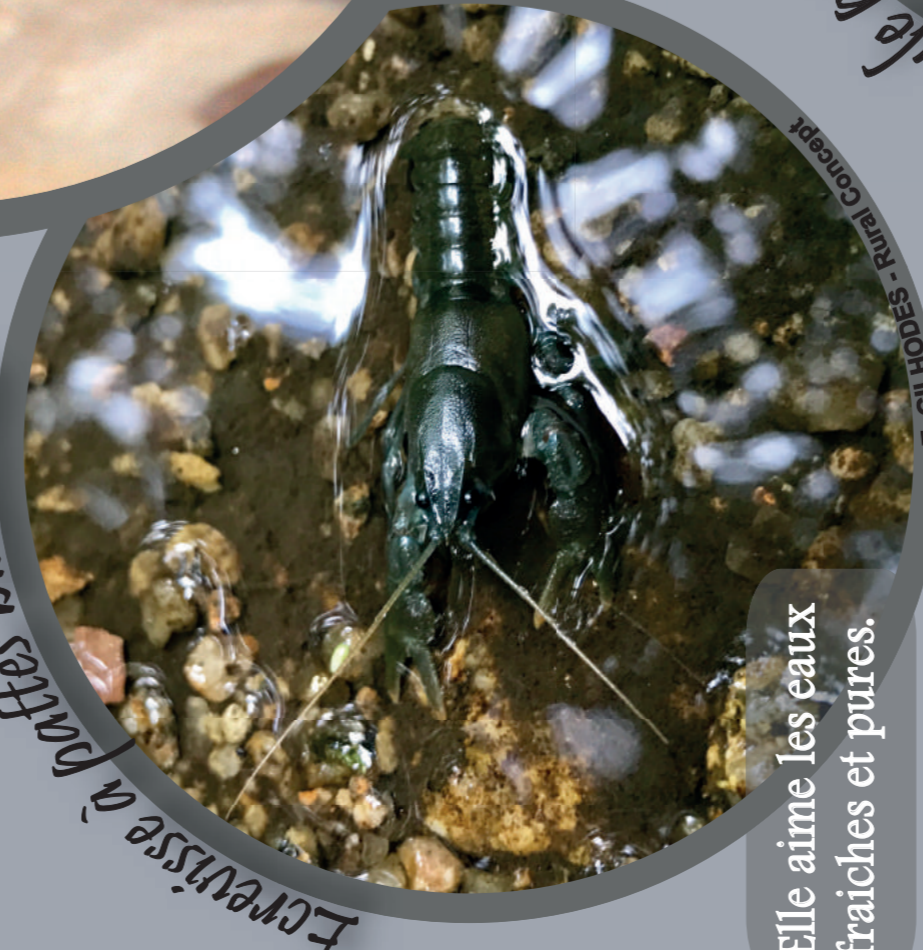
Ecrevisse à pattes blanches

Il a une envergure d'environ 40 cm mais ne pèse que 30 g et peut vivre 30 ans.