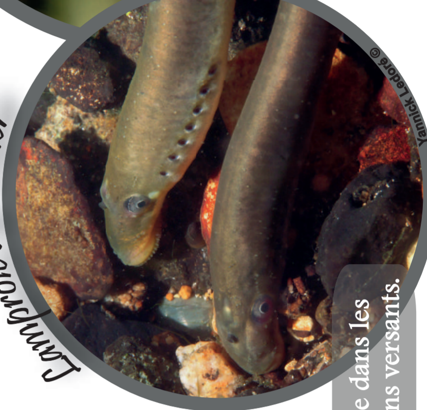
Lamproie de Planer

Elle passe 2 à 3 ans sous forme de larve.