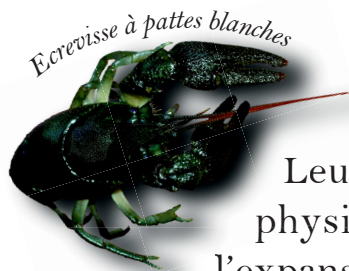
Ecrevisse à pattes blanches

Leur implantation participe à l'amélioration de la qualité physico-chimique des eaux du Viaur et favorise ainsi le retour ou l'expansion de nombreuses espèces patrimoniales (Mulette perlière, Ecrevisse à pattes blanches, Chabot, Lamproie de Planer, Truite..).