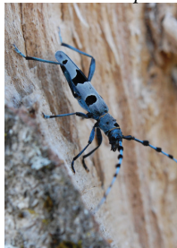
Rosalie des Alpes

Parmi la foule d'insectes qui gravite autour des vieux arbres, les saproxylophages (traduisez « mangeurs de bois mort ») sont sans aucun doute ceux qui leurs doivent le plus. Plusieurs espèces de coléoptères saproxylophages patrimoniales subsistent d'ailleurs en Aveyron grâce à la conservation des vieux arbres.